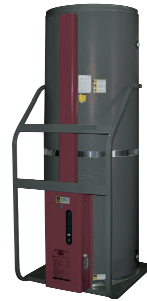
심야전기 온수기 100ℓ/200ℓ

■ 최상의 단열효과 전기온수기의 생명은 단열입니다. 밤시간에 데워진 물을 보온병 이상으로 보온시키는 우레탄 발포 기술은 귀뚜라미의 자랑입니다.