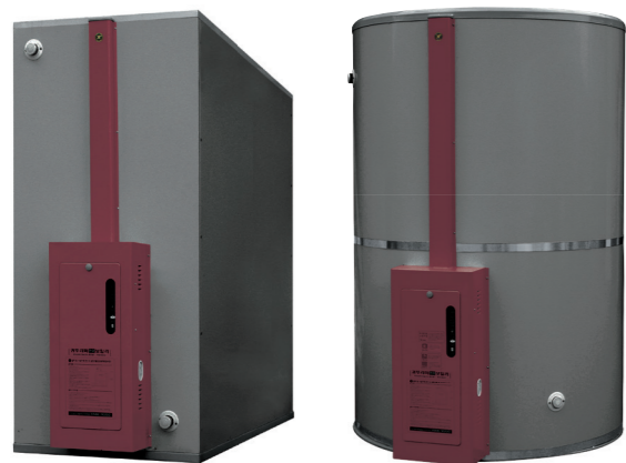
심야전기 보일러 (사각형)