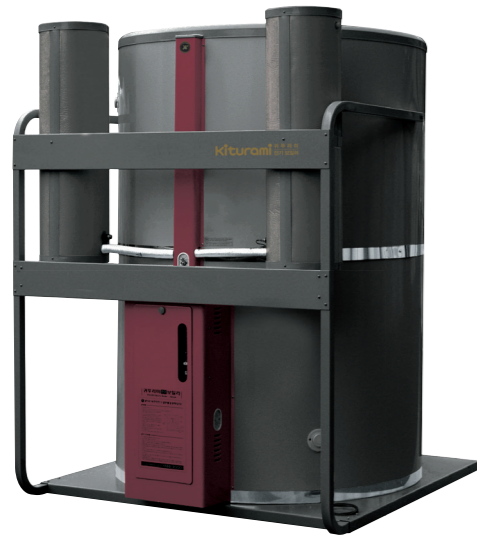
심야전기 보일러 (디렉스형)

· 심야 전기보일러의 이동이나 고장 등으로 내부의 물을 뺏을 경우 부식방지재를 재투입 하시기 바랍니다. · 부식방지재의 수명은 2~3년이며 주기적으로 교체를 해야됩니다. (별도구입)