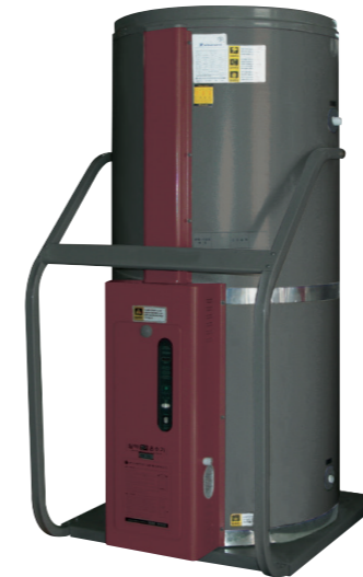
심야전기 온수기 300ℓ/400ℓ/500ℓ