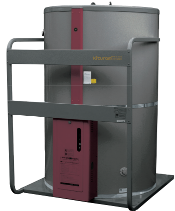
심야전기 보일러 (원형)